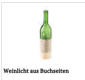
Weinlicht aus Buchseiten